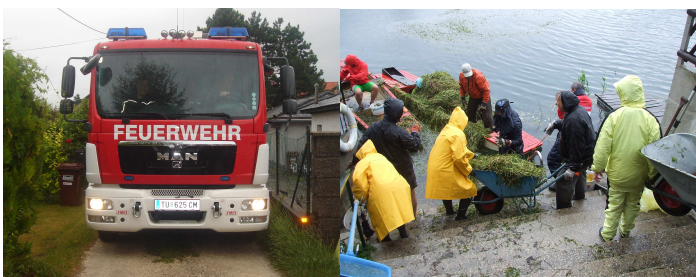
53 freiwillige Helfer trotzten jedem Wetter bei der Entsorgung

Entfernungsaktionen der Unterwasserblühpflanzen erforderlich. Dafür konnten insgesamt 53 freiwillige Mitarbeiter gewonnen werden. Gesamt wurden rund 22 Tonnen entfernt. Somit sind un-