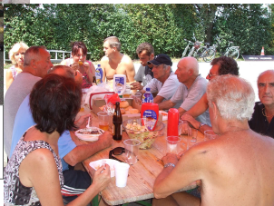
Mitarbeiter nach dem Wegräumen