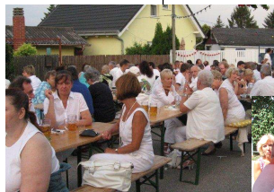
Gute Stimmung am Blasengelplatz