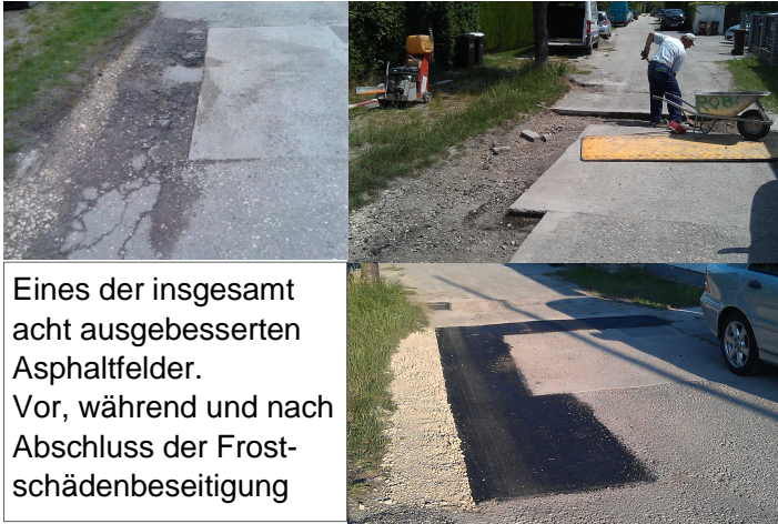
Eines der insgesamt acht ausgebesserten Asphaltfelder. Vor, während und nach Abschluss der Frostschädenbeseitigung

Die erforderlichen Frostschadensausbesserungen auf unseren Straßen wurden ordnungsgemäß binnen zweieinhalb Arbeitstagen durchgeführt.